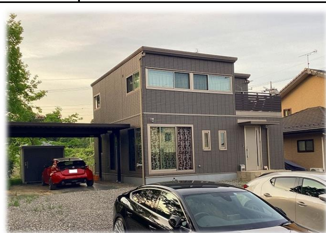
南西側より撮影現地外観 【掲載写真:2024年5月撮影 ※街並み含む】